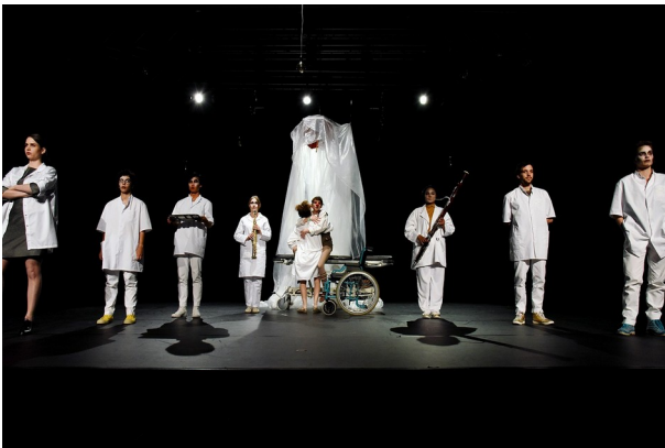
Le Clown lunatique et la Danseuse étoile , écrit et mis en scène par Camille Dénarié et Malvina Migné - Mai 2017.

En résidence à la Cithéâtre, au pied d'une barre d'immeuble du quartier la Vallonnaire dans le 9 ème arrondissement de Lyon, les membres de la compagnie ont à cœur de faire résonner leur pratique artistique au-delà du cadre de la représentation. Elles proposent des ateliers d'écriture et de théâtre auprès des habitant.e.s, en école primaire et en collège, en partenariat avec des structures socio-éducatives. Ces ateliers, souvent inspirés de leurs créations, nourrissent leur recherche, dans un double mouvement critique et pédagogique, confrontant leur pratique théâtrale à des réalités sociales.