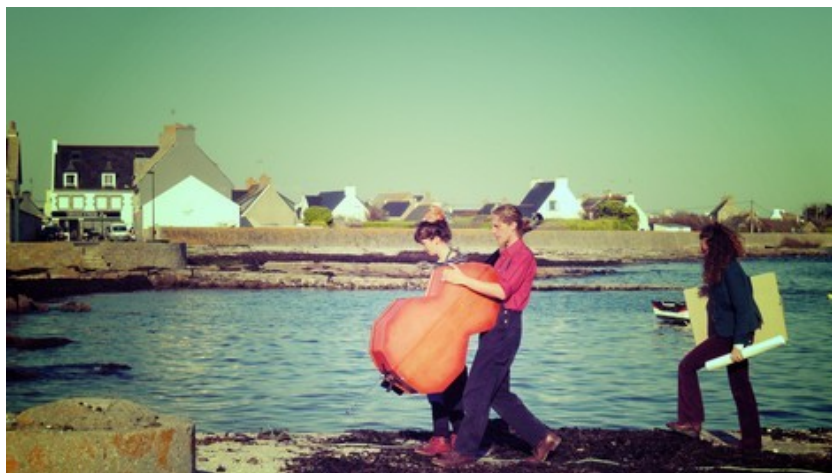
Ancrage , écrit et mis en scène par Malvina Migné - Février 2018.