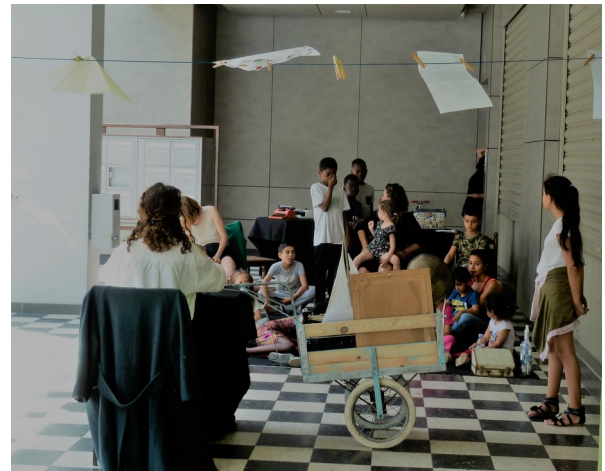
Presqu' Illisible , écrit et mis en scène par Malvina Migné - Juin 2019.